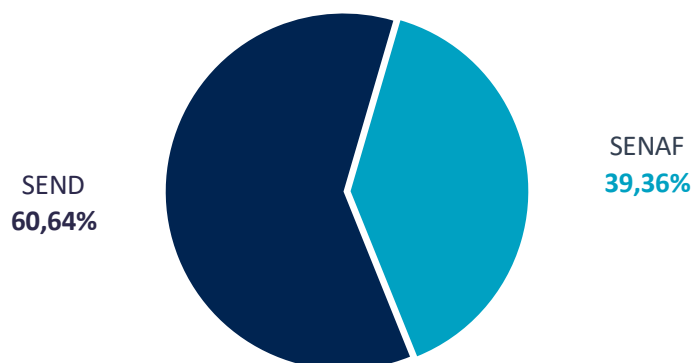
NEGOCIACIÓN DEUDA PÚBLICA Acumulado 2020. %